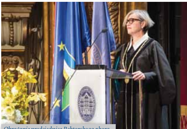
Obraćanje predsjednice Rektorskoga zbora

Rektor je na svečanoj sjednici dodijelio 23 počasna zvanja i titule professor emeritus umirovljenim profesorima Sveučilišta u Zagrebu, nagrade „Fran Bošnjaković“, „Andrija Mohorovičić“, „Andrija Štampar“ i „Ars summa universitatis“ za godinu 2021. te medalje Sveučilišta u Zagrebu.