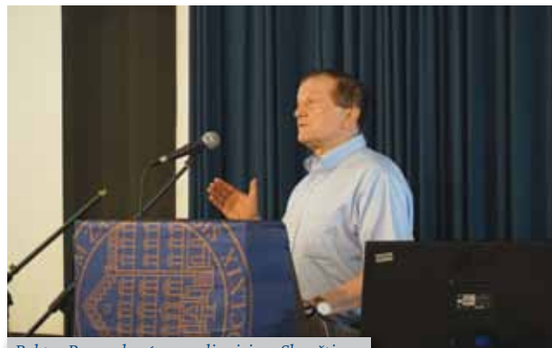
Rektor Boras obraća se sudionicima Skupštine

Nakon pozdravnih govora započeo je službeni dio sjednice te je predsjednik Saveza podnio Izvješće o radu za razdoblje od 2017. do 2021. godine. Tom je prilikom posebno zahvalio članovima tijela Saveza: Predsjedništva, Nadzornoga povjerenstva i Časnoga suda u prethodnom četverogodišnjem mandatu.