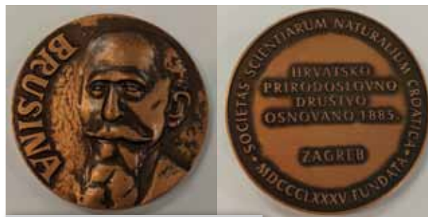
Medalja „Spiridion Brusina” – lice i naličje