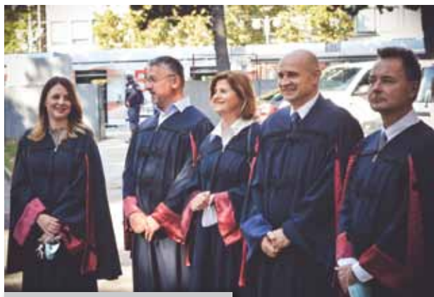
Nova Uprava Učiteljskoga fakulteta

U utorak, 5. listopada 2021. godine obilježili smo Dan Učiteljskoga fakulteta i Svjetski dan učitelja, a ujedno je predstavljena i nova Uprava Učiteljskoga fakulteta za mandatno razdoblje 2021./2022.-2023./2024. Svečanu akademiju svojom su nazočnošću uveličali gosp. Zoran Milanović, predsjednik Republike Hrvatske te brojni ostali visoki dužnosnici Vlade, Hrvatskog sabora, rektor našega i rektori drugih sveučilišta, dekani i prodekani ostalih sastavnica Sveučilišta u Zagrebu te ravnatelji agencija i ustanova s kojima Učiteljski fakultet uspješno surađuje.