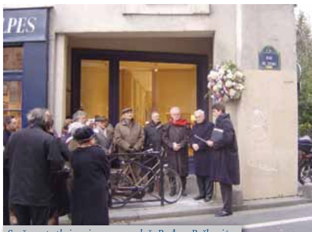
Svečanost otkrivanja spomen-ploče Ruđeru Boškoviću

23. listopada 1997. uz veliki broj prisutnih iz hrvatske dijaspore, predstavnika gradskih vlasti, hrvatskih veleposlanika, dužnosnika veleposlanstva i članova francuske Akademije, održana je ceremonija svečanog otkrivanja spomen-ploče u čast hrvatskog i francuskog znanstvenika Rogera Josepha