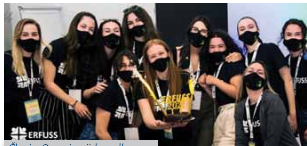
Članice Organizacijskog odbora