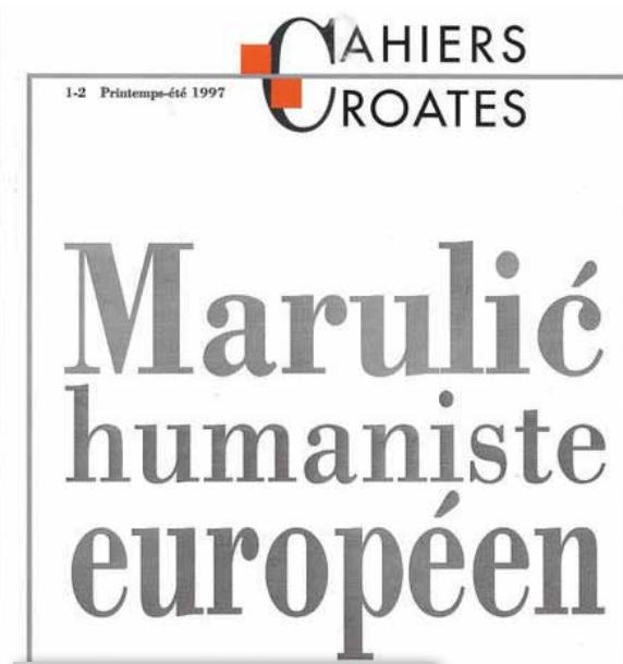
Naslovnica prvog dvobroja Cahiers Croates