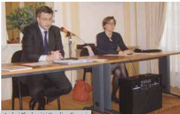
Andrej Plenković i Caroline Ferrari

5. svibnja 2009. g. održan je sastanak s Andrejem Plenkovićem, zamjenikom veleposlanika Republike Hrvatske koji je uz sudjelovanje gospođe Caroline Ferrari, zamjenice šefa Odjela za odnose zajednice i Unije, Uprava Europske unije govorio o temi „Pregovori o pristupanju Republike Hrvatske Europskoj uniji”. Sastanak je održan u prostorijama Veleposlanstva Republike Hrvatske u Parizu.