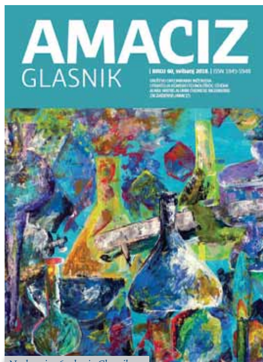
Naslovnica 60. broja Glasnika

Od važnijih dosegâ treba spomenuti Glasnik, koji neprekidno izlazi od 1992. godine dva puta godišnje, tako da je do sada izašlo 62 broja. Nadalje, izdana je knjižica prigodom 10 godina AMACIZ-a (2000.), a svakih 5 godina izdane su knjižice o ak-