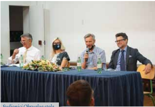
Sudionici Okruglog stola

s kojima se susreću u svakodnevnom radu. Predstavници udruga kroz primjere dobre prakse predstavili su aktivnosti koje provode, a usmjerene su na privlačenje, uključivanje, motiviranje i povezivanje alumna, studenata i šire gospodarstvene zajednice s ciljem doprinosa boljitku nas samih, kao i cijele Republike Hrvatske.