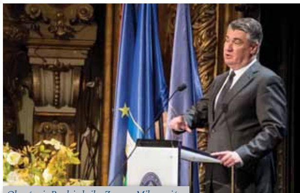
Obraćanje Predsjednika Zorana Milanovića