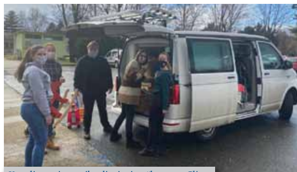
Koordinatorice s prikupljenim igračkama za Glinu