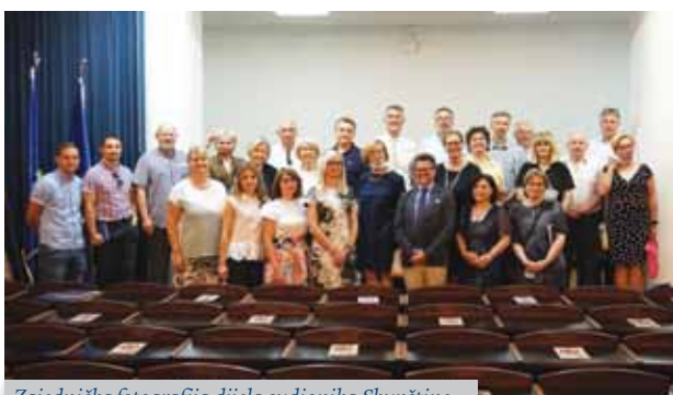
Zajednička fotografija dijela sudionika Skupštine

Na Učiteljskome fakultetu Sveučilišta u Zagrebu u četvrtak, 1. srpnja 2021. održana je Izborna skupština Saveza društava bivših studenata Sveučilišta u Zagrebu – ALUMNI UNIZG na kojoj je izabran predsjednik i članovi tijela Saveza za sljedeći četverogodišnji period. Na Skupštini je bilo prisutno pedesetak alumna, većinom predsjednika i predstavnika alumni društava sa sastavnica Sveučilišta u Zagrebu te dekani i prodekani pojedinih fakulteta. Svečani skup započeo je intoniranjem akademske himne Gaudeamus igitur , nakon čega se okupljenima obratio predsjednik Predsjedništva Saveza, prof. dr. sc. Mario Šafran, pozdravivši sve okupljene uzvanike i alumne našega Sveučilišta.