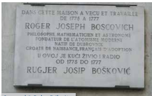
Spomen-ploča Ruđeru Boškoviću