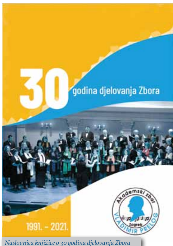
Naslovnica knjižice o 30 godina djelovanja Zbora

U 2021. godini Akademski zbor Vladimir Prelog obilježava 30 godina djelovanja. Osnovan je u veljači 1991. kao prva sekcija Društva diplomiranih inženjera i prijatelja Kemijsko-tehnološkog studija Sveučilišta u Zagrebu ( Almae Matris Alumni Chemicae Ingeniariae Zagrabensis , AMACIZ), s imenom Chemicae ingeniariae alumni . Zbor okuplja bivše studente sadašnjeg Fakulteta kemijskog inženjerstva i tehnologije (FKIT) različitih generacija, ali i pjevače obrazovane na drugim fakultetima Sveučilišta u Zagrebu. Od 2004. djeluje kao Akademski zbor „Vladimir Prelog“.