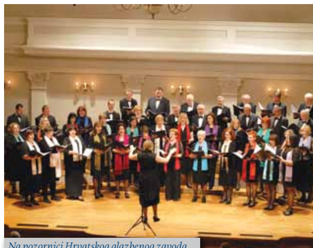
Na pozornici Hrvatskog glazbenog zavoda