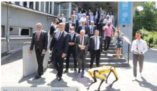
Uzvanici na otvorenju CRTA-e

28. lipnja 2021. na Fakultetu strojarstva i brodogradnje Sveučilišta u Zagrebu svečano je otvoren Regionalni centar izvrsnosti za robotske tehnologije (CRTA). To je ujedno i prvi centar izvrsnosti za robotiku u Hrvatskoj koji objedinjuje laboratorije za autonomne sustave, računalnu inteligenciju i medicinsku robotiku. Projekt je procijenjen na gotovo 38 milijuna kuna, a Europska unija je, u sklopu Operativnoga programa „Konkurentnost i kohezija“, pokrila gotovo 37 milijuna kuna.