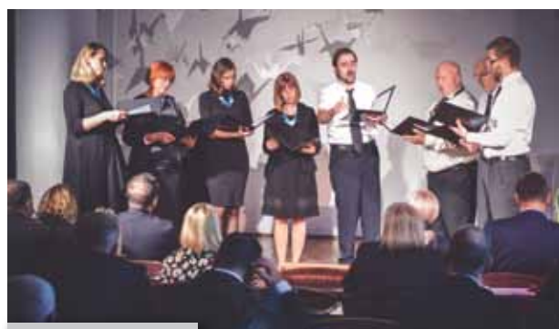
Kulturni dio programa

Osobitu je čast Učiteljskome fakultetu svojim sudjelovanjem na svečanoj akademiji iskazao gospodin Zoran Milanović, predsjednik Republike Hrvatske. Posjetivši prvi put našu instituciju, izrekao je asocijacije povezane s osobnim odrastanjem i obrazovanjem uz majku učiteljicu. U svom je obraćanju naglasio važnost profesionalne kompetencije, ali i kompetitivnosti institucije u okvirima Republike Hrvatske i u širem europskome kontekstu.