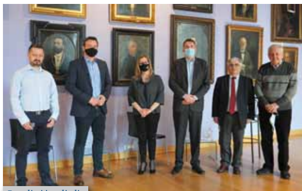
Panelisti i voditelj

online, a kako bi studenti mogli na najbezboljniji način nastaviti svoje studiranje, Učiteljski je fakultet putem donacija uspio osigurati 50 prijenosnih računala, dok su pomoć ponudili i brojni drugi gospodarski subjekti. Također, od volonterskih projekata istaknula je onaj pod nazivom Zadaću napiši, jedinicu izbriši u kojem studenti Učiteljskoga fakulteta volonterski pomažu učenicima kojima je potrebna pomoć u učenju.