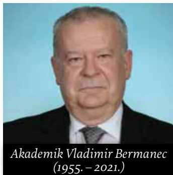
Akademik Vladimir Bermanec (1955. – 2021.)

Na osnovi izvora: https://www.irb.hr/Novosti/In-memoriam-akademiku-Nenadu-Trinajsticu i https://www.info.hazu.hr/2021/08/nenad-trinajstic/