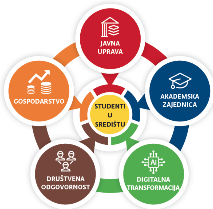
Slika 1. Penta Helix model djelovanja Sveučilišta u Zagrebu.