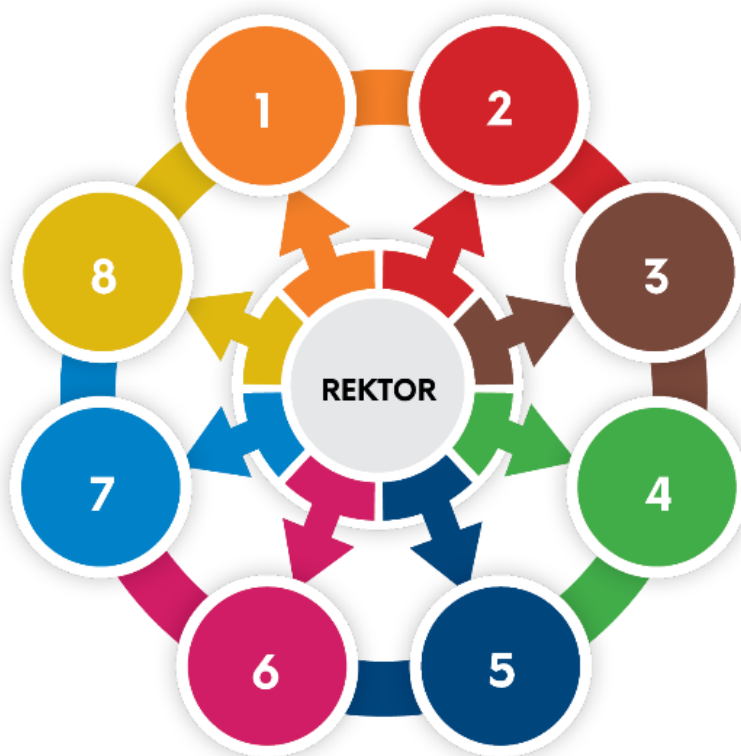
Slika 3. Organizacijska struktura resora.