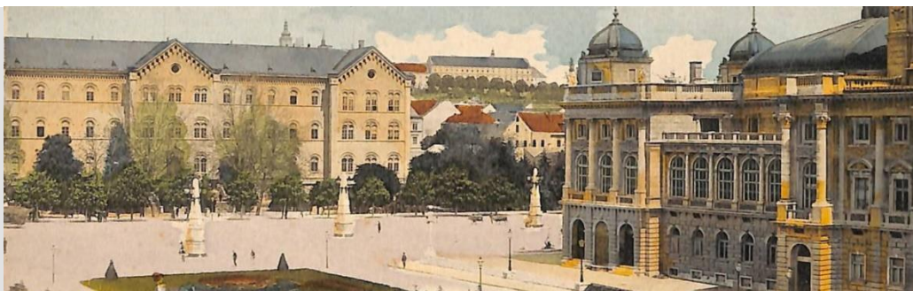
Sveučilište u Zagrebu i Hrvatsko narodno kazalište (razglednica, 1914.)

Sveučilište u Zagrebu najveće je sveučilište u Hrvatskoj, a svojim je kontinuiranim djelovanjem od druge polovice 17. stoljeća i među najstarijim sveučilištima u Europi.