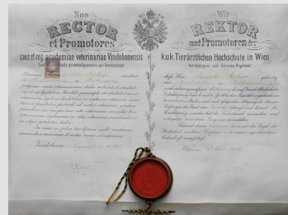
Original diplome Veterinarske visoke škole iz Beča na latinskom i njemačkom jeziku (1906.)

Topoteka Sveučilišta u Zagreba otvorena je svima zainteresiranima za suradnju. Za više informacija javite se na vlemic@unizg.hr