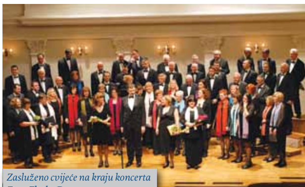
Zasluzeno cvijec na kraju koncerta

Kao i uvijek, primjeren dio Glasnika su izvješća sekcija AMACIZ-a.