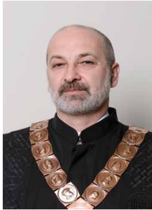
prof. dr. sc. MILOŠ JUDAŠ prorektor za znanost, međuinstitucijsku i međunarodnu suradnju Sveučilišta u Zagrebu

Rođen je 1962. u Vinkovcima. Diplomirao je klavir na Royal College of Music u Londonu sa samo 19 godina kao najmlađi diplomant u povijesti ove institucije. Završio je poslijediplomski studij klavira na Muzičkoj akademiji Sveučilišta u Zagrebu. Suradivao je s brojnim istaknutim svjetskim umjetnicima i pedagogima, a posebno je značajna njegova profesionalna suradnja s britanskim orguljašem i pijanistom Wayneom Marshallom s kojim već dugo godina uspješno nastupa. Bio je prodekan za međunarodnu suradnju i informatiku (od 2001.) te dekan Muzičke akademije Sveučilišta u Zagrebu u dva mandata. Začetnik je suradnje triju umjetničkih akademija Sveučilišta u Zagrebu, čime je osnažen utjecaj umjetničkog područja na razini Sveučilišta te obogaćen kulturni život Grada Zagreba. Obnašao je funkciju člana Kulturnog vijeća za glazbu pri Ministarstvu kulture Republike Hrvatske, bio je CMU koordinator pri CARNet-u, 2009. imenovan je članom Matičnog odbora za umjetnost pri Ministarstvu znanosti, obrazovanja i sporta, a odlukom Sabora Republike Hrvatske u listopadu 2011. imenovan je članom Nacionalnog vijeća za znanost. Dobitnik je brojnih nagrada i priznanja. Dao je poseban doprinos u realizaciji projekta izgradnje nove zgrade Muzičke akademije Sveučilišta u Zagrebu.