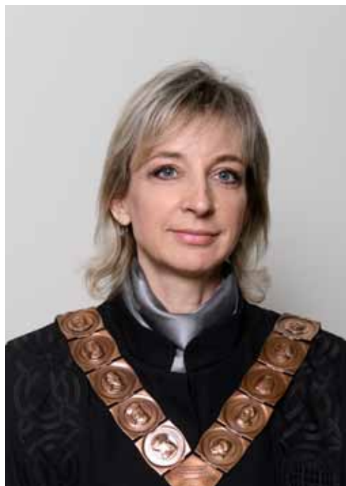
prof. dr. sc. IVANA ČUKOVIĆ-BAGIĆ prorektorica za studente, studije i upravljanje kvalitetom Sveučilišta u Zagrebu

Rođen je 1949. u Splitu. Na Filozofskom fakultetu Sveučilišta u Zagrebu diplomirao je 1975. filozofiju i latinski jezik. Godine 1976. završio je poslijediplomski tečaj Ethik und Gesellschaftstheorie na Interuniverzitetskom centru za postdiplomske studije u Dubrovniku, a doktorsku disertaciju obranio je 1989. na Filozofskom fakultetu Sveučilišta u Zagrebu. Od 1993. predstojnik je Katedre za etiku, a od 2010. pročelnik Odsjeka za filozofiju Filozofskog fakulteta Sveučilišta u Zagrebu. Od njegovog osnivanja 2006., voditelj je Referalnog centra za bioetiku u jugoistočnoj Europi. Obnašao je brojne dužnosti, između ostaloga, bio je ministar znanosti, tehnologije i informatike u Vladi demokratskog jedinstva Republike Hrvatske (1991.-1992.), potpredsjednik Bioetičkog povjerenstva Vlade Republike Hrvatske za praćenje genetski modificiranih organizama (2000.-2003.) te član Vijeća za GMO Vlade Republike Hrvatske (2008.-2013.). Član je Hrvatskog filozofskog društva u kojem je obnašao dužnost tajnika, a zatim i predsjednika. Jedan je od osnivača Kluba hrvatskih humboldtovaca te Hrvatskog bioetičkog društva. Dobitnik je Spomenice domovinskog rata (1993.), Povelje Hrvatskoga sabora za izniman doprinos u stvaranju samostalne i suverene Hrvatske (2010.), Nagrade Grada Zagreba za znanost (2014.) te drugih nagrada i priznanja. Bio je glavni i odgovorni urednik nekoliko domaćih i međunarodnih časopisa.