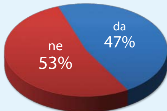
Slika 2.: Grafički prikaz strukture odgovora na pitanje „Smatrate li da je organizacija studija prema načelu 3+2 korisna za vašu struku?“

Ukupan broj valjanih odgovora iznosi 1712.