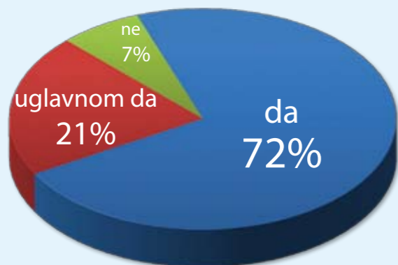
Slika 1.: Struktura uzorka prema odgovoru na pitanje „Je li preddiplomski studij koji ste završili bio Vaš prvi izbor?“ (tj. ono što ste željeli studirati)

Ukupan broj valjanih odgovora u ovom slučaju iznosi 1702.