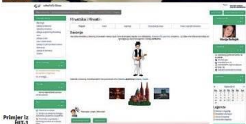
Primjer iz HIT-1

vih izraza na inome jeziku, ali ako želite progovoriti na tom jeziku i ako želite nadograđivati i razvijati sve jezične djelatnosti, onda one bez razgovora s nastavnikom nisu dovoljne, posebno ne našim iseljenicima koji žele čuti živu hrvatsku riječ i razgovarati na jeziku svojih predaka, a mnogima je od njih to jedina prilika za razgovor s izvornim govornicima hrvatskoga jezika.