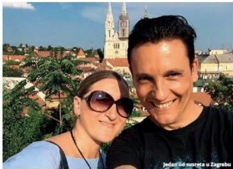
Jedan od susreta u Zagrebu

Sve nam ovo govori da je izrada tečajeve za više razine neophodna i da bismo u skorij budućnosti to trebali i pro-